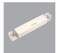
Q-BIC MC RG-QB