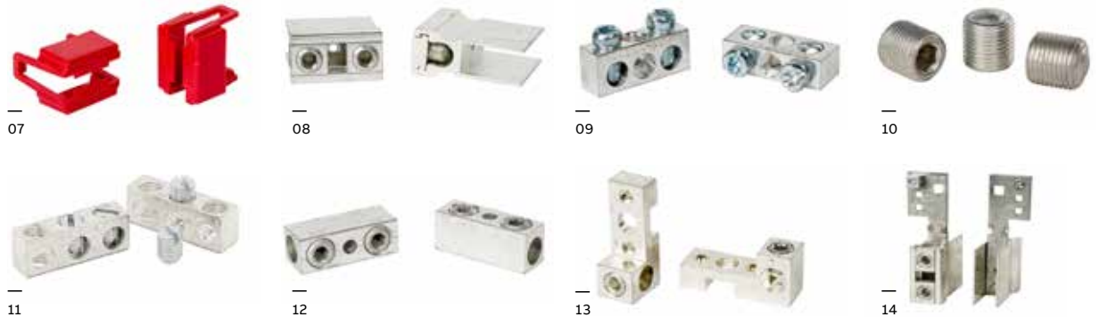
ABB Électrification Canada SRI Produits d'installation 700, avenue Thomas Saint-Jean-sur-Richelieu, Québec J2X 2M9 Tél.: +1 (450) 347 5318 Sans frais: +1 (800) 362 2952 Fax: +1 (450) 347 1976

Nous nous réservons le droit de procéder à des modifications techniques ou des changements de contenu de ce document sans préavis. Pour ce qui concerne les commandes d'achat, les modalités convenues prévaudront. ABB inc. n'accepte aucune responsabilité d'aucune sorte pour des erreurs potentielles ou des manques possibles d'information dans ce document.