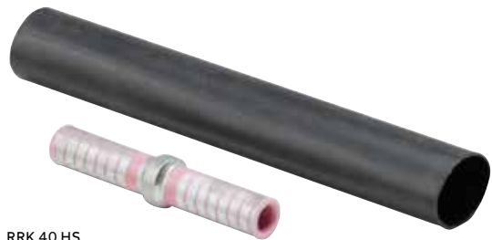
RRK 40 HS

Nécessaires d'épissures à compression en aluminium, enveloppe thermorétractable