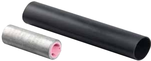
ULSK 500 HS