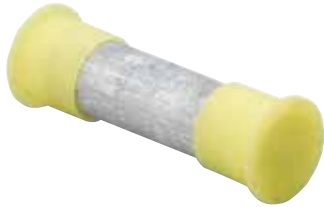
U 1 B 1010 EC

Matrices 5/8 po de séries U 1 B MC et CS MC