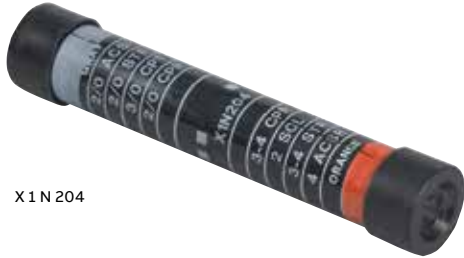
X1 N 204

Épissures isolées en aluminium (à compression) – Matrices de la Série 840