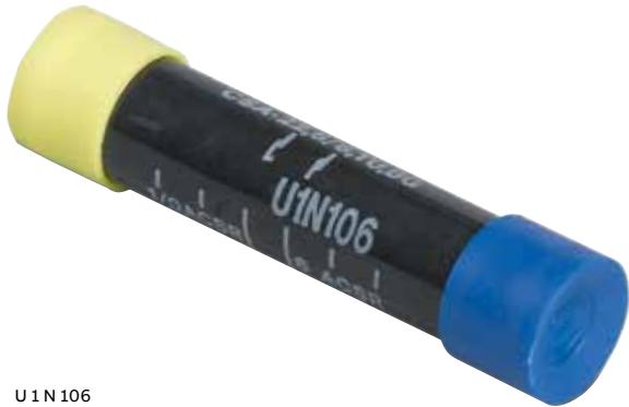
U 1 N 106

Épissures isolées en aluminium (à compression) – Matrices 5/8 po Série U 1 N (longueur : 3¼ po)