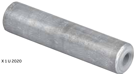
X 1 U 2020

Épissures non isolées en aluminium (à compression) – Matrices de la Série 840