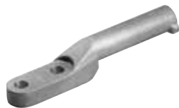
PT 2 N 795