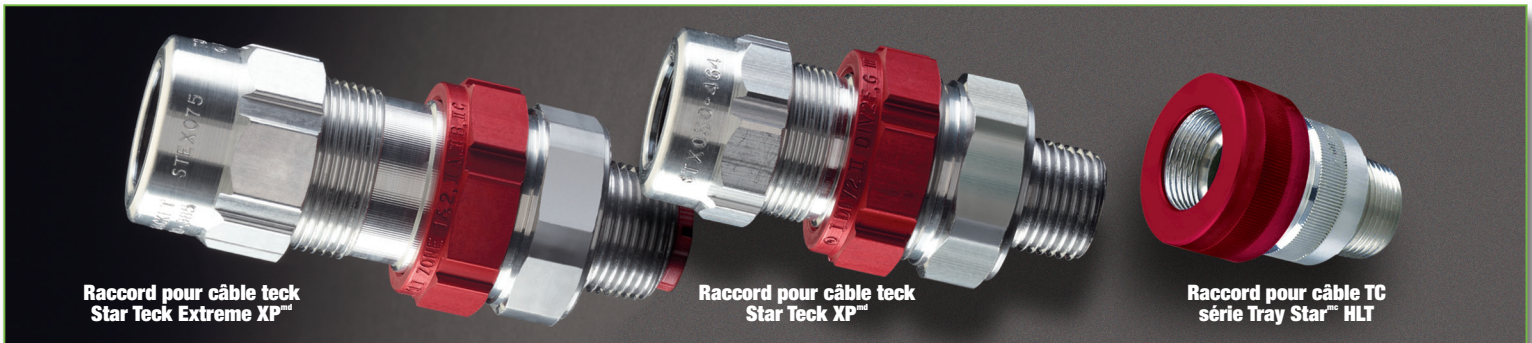
Raccord pour câble teck Star Teck Extreme XP™