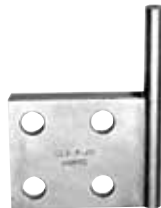
CEA 4 50