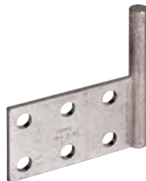
CEA 6 75