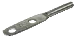
CEA 2 50

Pour l'ajout en usine d'inhibiteur d'oxydation, ajoutez le suffixe « C » au numéro de catalogue.